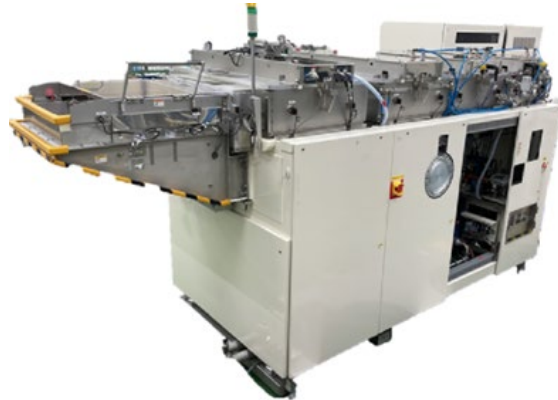
今回の研究で用いた成膜装置のイメージ

住友重機械工業株式会社（本社：東京都品川区、代表取締役社長：渡部敏朗、以下「住友重機械」）と、高知工科大学（高知県香美市、学長：蝶野成臣）の山本哲也総合研究所マテリアルズデザインセンター長らは、共同研究において、住友重機械独自の反応性プラズマ蒸着法（RPD 法）（※1）を利用し、酸化亜鉛（ZnO）として世界で初めて膜厚 10 ナノメートル（ナノメートルは 10 億分の 1 メートル）の結晶状態の透明導電膜をガラス基板上に形成する技術を開発しました。これにより、将来の透明導電膜、バッファ膜・シード膜（※2）として研究が進められる ZnO 膜を、ガラス基板上に極めて薄く結晶状態で形成する手段として、RPD 法の有用性が示されました。